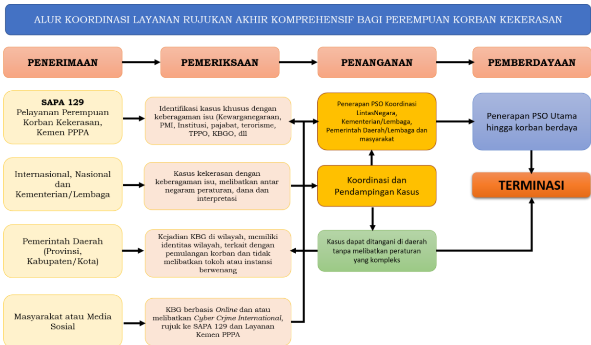
Bagan 1. Alur Koordinasi Layanan Rujukan Akhir bagi Perempuan Korban Kekerasan