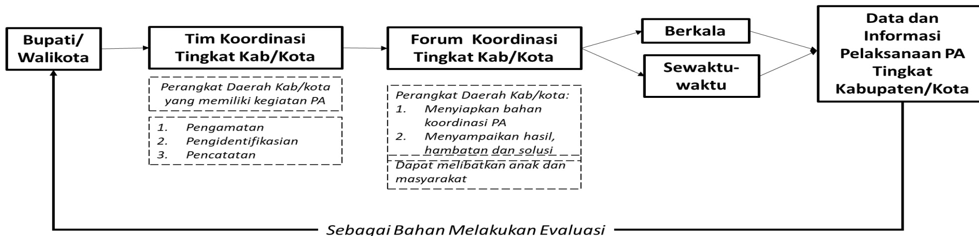
BAGAN KOORDINASI PEMANTAUAN PENYELENGGARAAN PERLINDUNGAN ANAK TINGKAT DAERAH KABUPATEN/KOTA

MENTERI PEMBERDAYAAN PEREMPUAN DAN PERLINDUNGAN ANAK REPUBLIK INDONESIA,