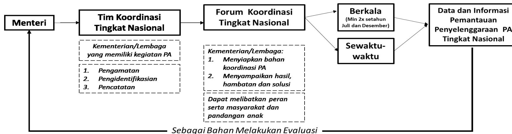
BAGAN KOORDINASI PEMANTAUAN PENYELENGGARAAN PERLINDUNGAN ANAK TINGKAT NASIONAL

MENTERI PEMBERDAYAAN PEREMPUAN DAN PERLINDUNGAN ANAK REPUBLIK INDONESIA,